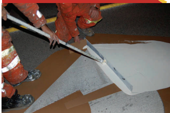
Flèche en Permamark

“Le Permamark va révolutionner le marquage longue durée au Québec”