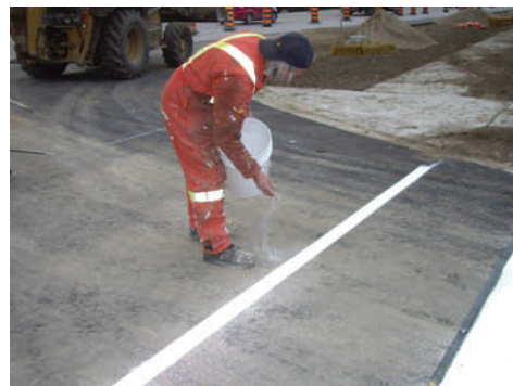
Billes de verre

Afin de rallonger la vie du produit et d’augmenter la sécurité des usagers de la route, on saupoudre des billes de verre lors de l’application du Permamark. Ces billes de verre spéciale sont fournis avec le produit.