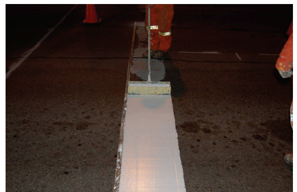
Facile à installer

Vous désirez une démonstration du produit, veuillez nous contacter au 514-766-3567 ou au 1-800-667-3567.